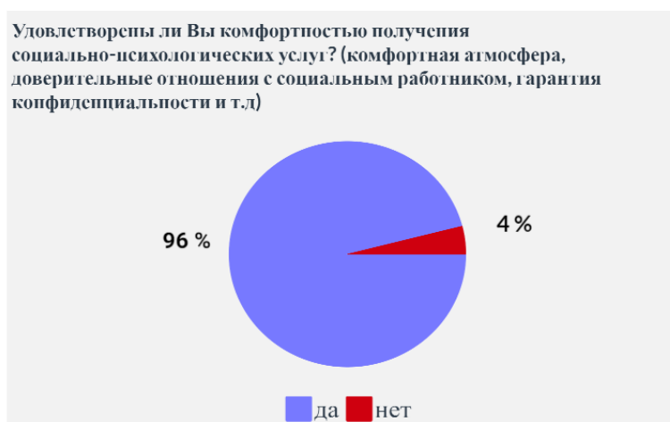
Рисунок 6. Удовлетворённость комфортностью получения социально-психологических услуг

Следующий вопрос «Удовлетворены ли вы комфортностью получения социально-психологических услуг (комфортная атмосфера, доверительные отношения с социальным работником, гарантия конфиденциальности)?». Большинство опрошенных остались удовлетворены, соотношение ответов: 48 респондентов ответили «да», 2 респондента выбрали ответ «нет» (рис. 6).