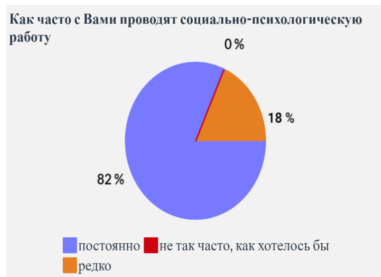
Рисунок 4. Частота проведения социально-психологической работы

Из ответов на данный вопрос можно сделать вывод, что большинство опрошенных удовлетворены частотой оказания социально-психологической помощи и получают её в необходимом объёме.