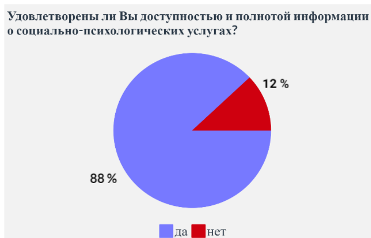
Рисунок 2. Удовлетворённость доступностью и полнотой информации о социально-психологических услугах

Ответы на следующий вопрос «Удовлетворены ли вы доступностью и полнотой информации о социально-психологических услугах?» распределены таким образом: да – 44 респондента, нет – 6 респондентов (рис. 2). Большинство опрошенных отметили свою удовлетворенность.