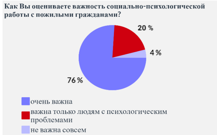
Рисунок 1. Оценка важности социально-психологической работы с пожилыми гражданами

Ответы на следующий вопрос «Удовлетворены ли вы доступностью и полнотой информации о социально-психологических услугах?» распределены таким образом: да – 44 респондента, нет – 6 респондентов (рис. 2). Большинство опрошенных отметили свою удовлетворенность.