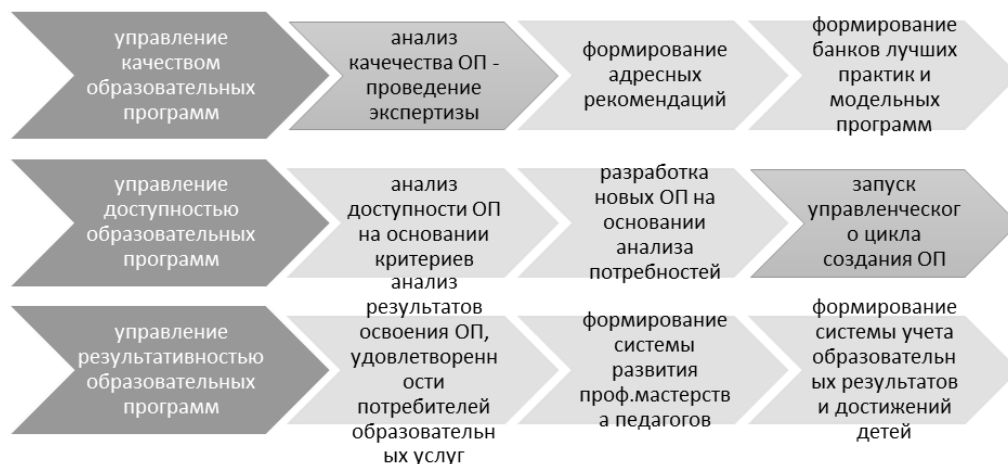
Рисунок 1. Компоненты управленческого цикла.

Управленческий процесс, показанный на рисунке 1, пронизывает компоненты системы управления, обеспечивая интеграционные процессы при выполнении задач повышения качества, доступности и эффективности (см. рисунок 1).