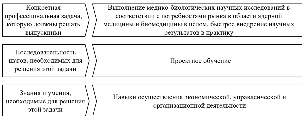
Рисунок 3. Применение метода проектного обучения при проектировании и реализации программ биомедицинской направленности

Модуль предпринимательских компетенций. Инновационная модель развития биомедицины на основе достижений фундаментальной науки предусматривает выполнение медико-биологических научных исследований в соответствии с потребностями рынка в области ядерной медицины и биомедицины в целом, быстрое внедрение научных результатов в практику, целенаправленную подготовку специалистов, способных обеспечить создание новых медицинских технологий «прорывного характера» и их активное внедрение. Формированию у студентов предпринимательских компетенций способствует включение в программу магистратуры экономических, управленческих и других составляющих, что позволяет выпускникам программы сочетать исследовательскую, проектную, технологическую и предпринимательскую деятельность (рис.3).