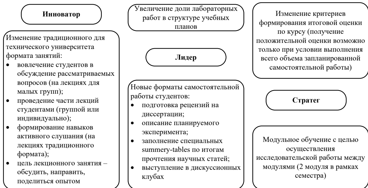
Рисунок 4. Механизм формирования гибких навыков в результате использования интерактивных методов обучения в процессе реализации международных программ биомедицинской направленности в МИФИ

Ключевой особенностью организации образовательного процесса на междисциплинарных международных программах МИФИ является изменение традиционного для технического университета формата занятий с целью подготовки лидеров и новаторов (рис. 4).